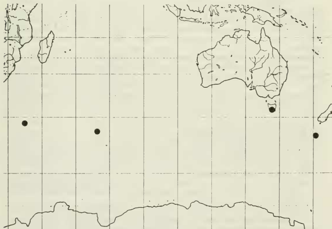
Abb.2: Verbreitung von Fuscidea asbolodes

TASMANIEN: Mt. Sprent, quartzite outcrops in Gymnoschoenus moorland, 650 m alt, locally common, 5.II.1987, leg. G.KANTVILAS no. 3/87 (M = dupl. ex herb. KANTVILAS).